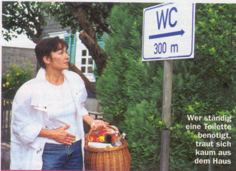
Wer ständig eine Toilette benötigt, traut sich kaum aus dem Haus

Neuen Erkenntnissen zufolge weiß man heute, dass der Becken-